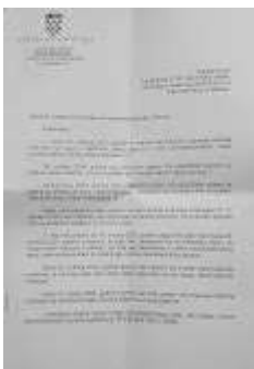
Dopis JB 14.06.2023 (1).jpg 626K